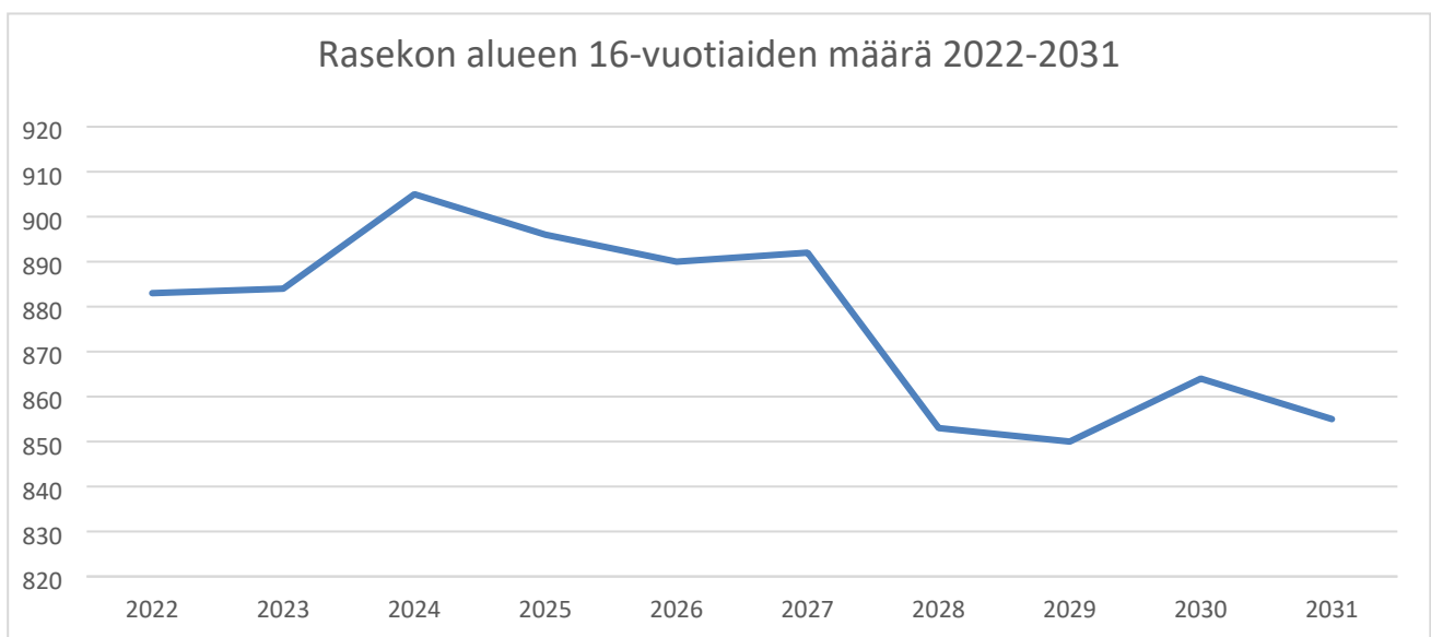
Taulukko 2. Rasekon alueen 16-vuotiaiden määrän kehitys 2022-2031.